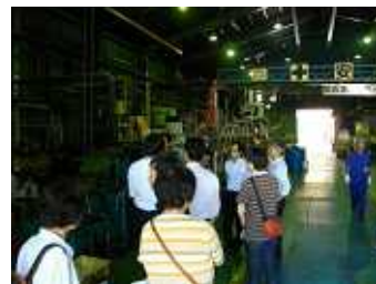
熱処理ライン見学の様子

今回の見学では浸炭熱処理や真空窒化処理のラインを見ることができました。 熱処理炉のなかを覗くことが出来たのですがドリルビス(コンクリートや鉄板に負けない強さが必要)が真っ赤になっている状態が間近で見れました！